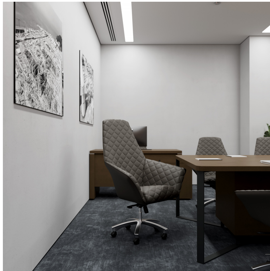
Помещение 5.32. Вид 2. Переговорная.