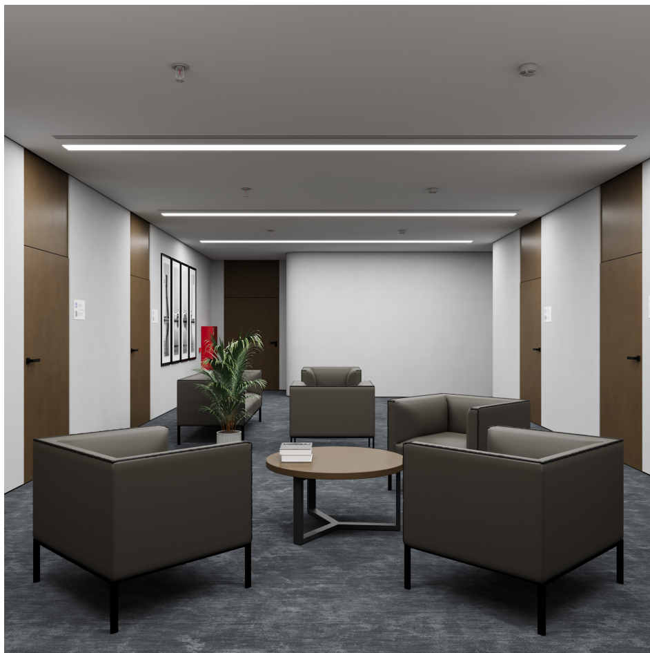
Помещение 5.1. Вид 5. Холл.