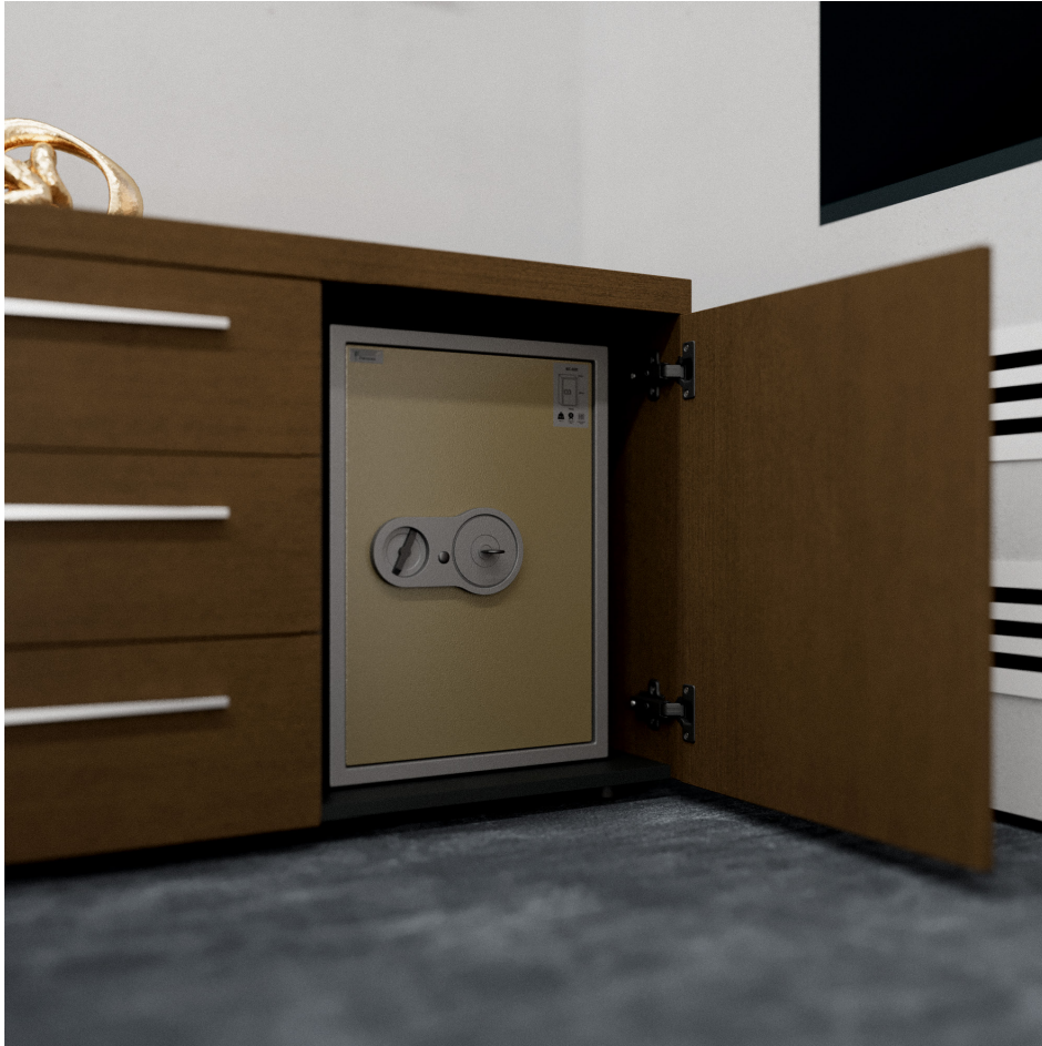
Помещение 5.30. Вид 5. Кабинет генерального директора.