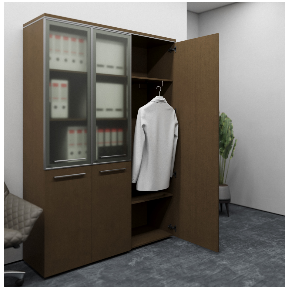
Помещение 5.31. Вид 4. Кабинет заместителя генерального директора.