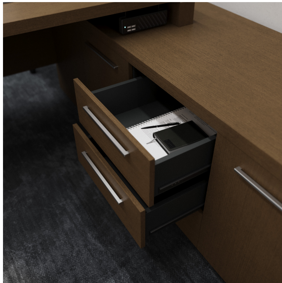
Помещение 5.31. Вид 6. Кабинет заместителя генерального директора.