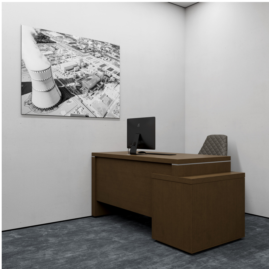
Помещение 5.32. Вид 5. Переговорная.