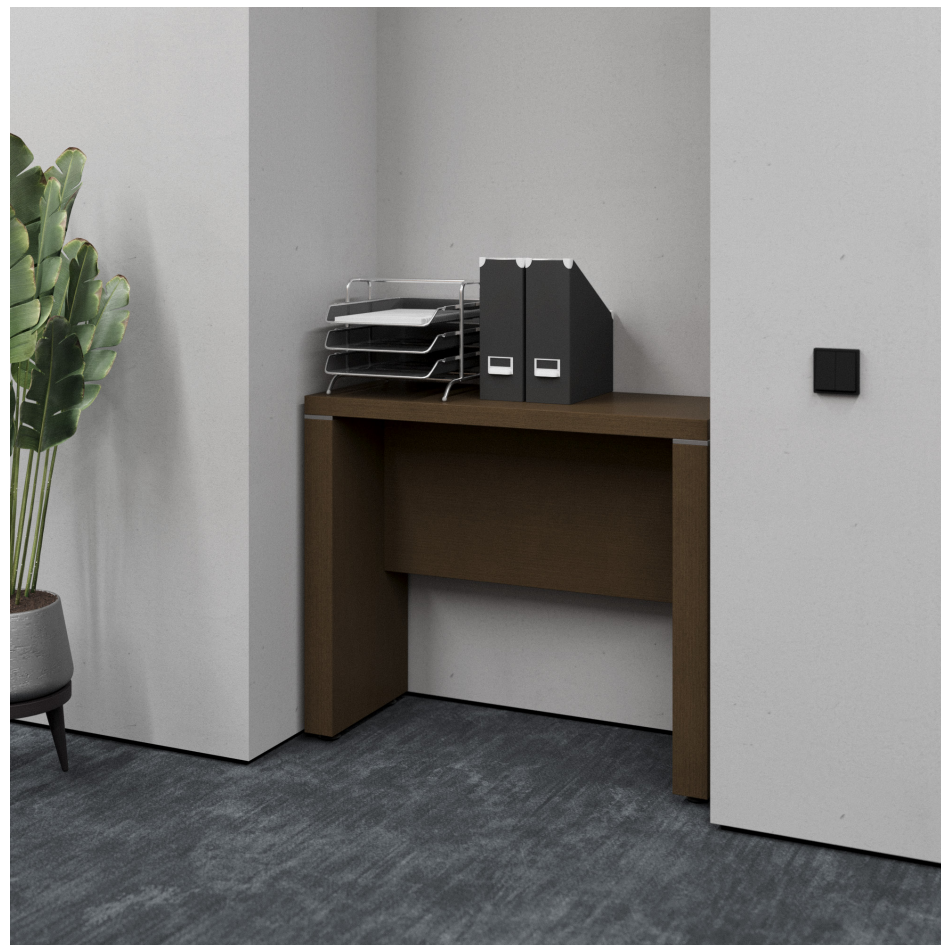
Помещение 5.32. Вид 6. Переговорная.