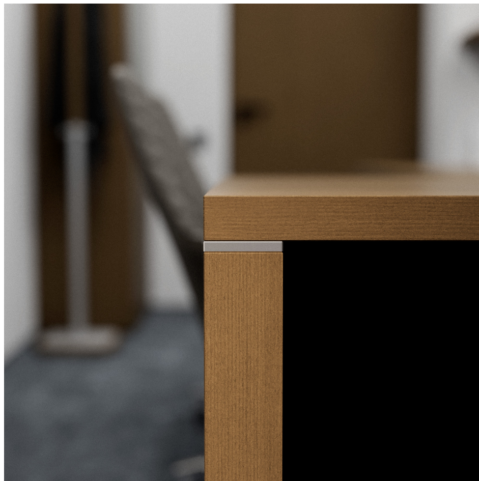
Помещение 5.30. Вид 4. Кабинет генерального директора.