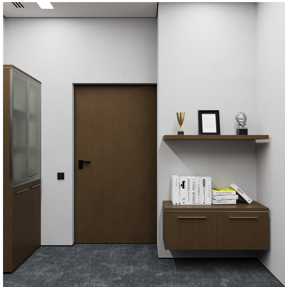
Помещение 5.30. Вид 8. Кабинет генерального директора.