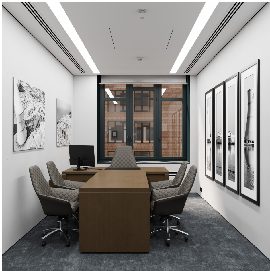
Помещение 5.30. Вид 1. Кабинет генерального директора.