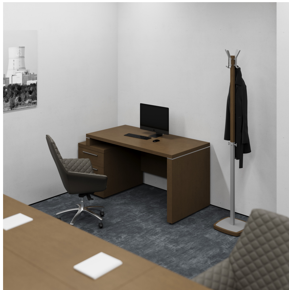
Помещение 5.27. Вид 4. Переговорная.