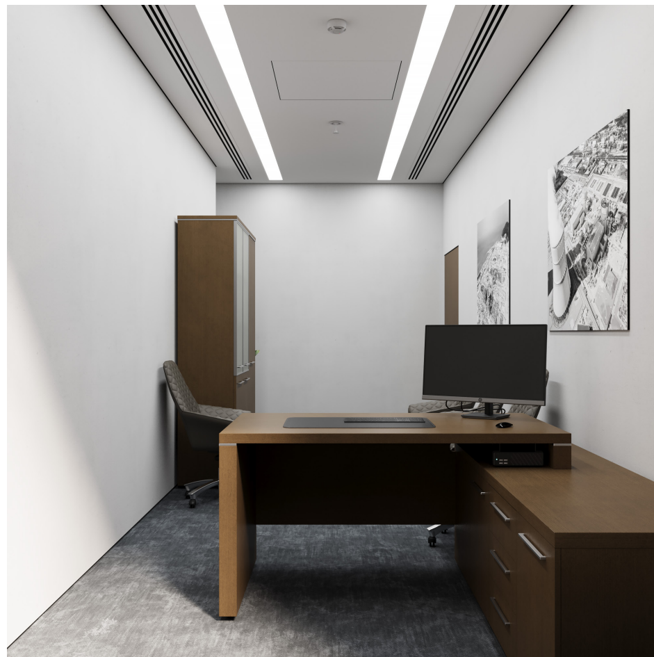
Помещение 5.31. Вид 2. Кабинет заместителя генерального директора.