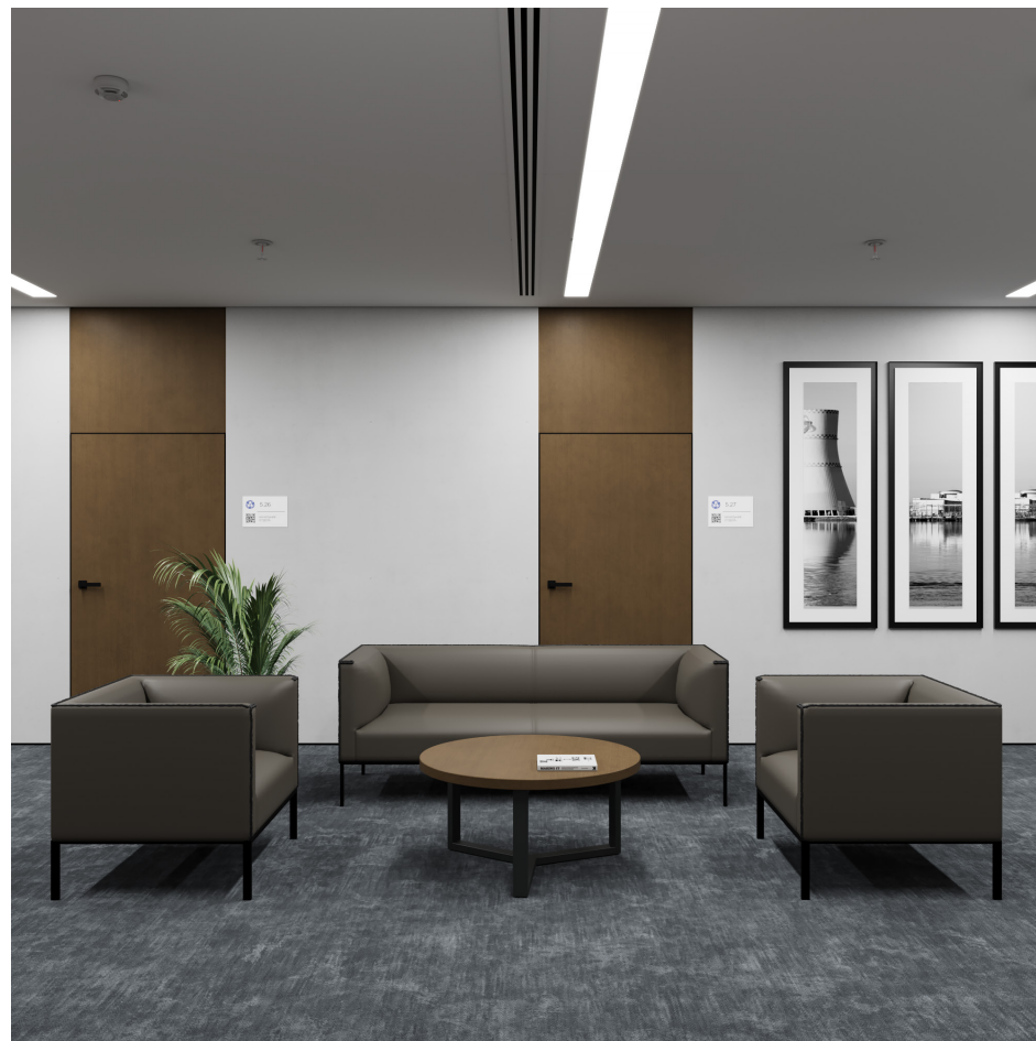
Помещение 5.1. Вид 2. Холл.