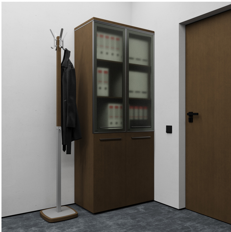
Помещение 5.30. Вид 7. Кабинет генерального директора.