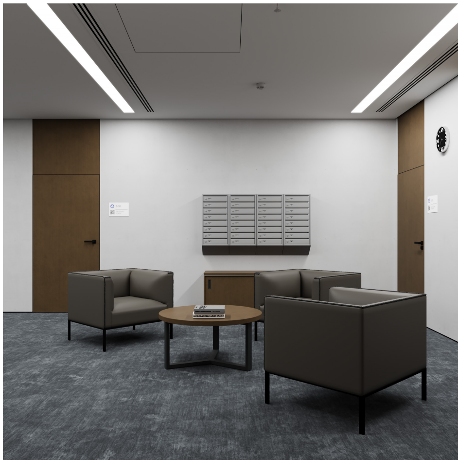
Помещение 5.1. Вид 3. Холл.