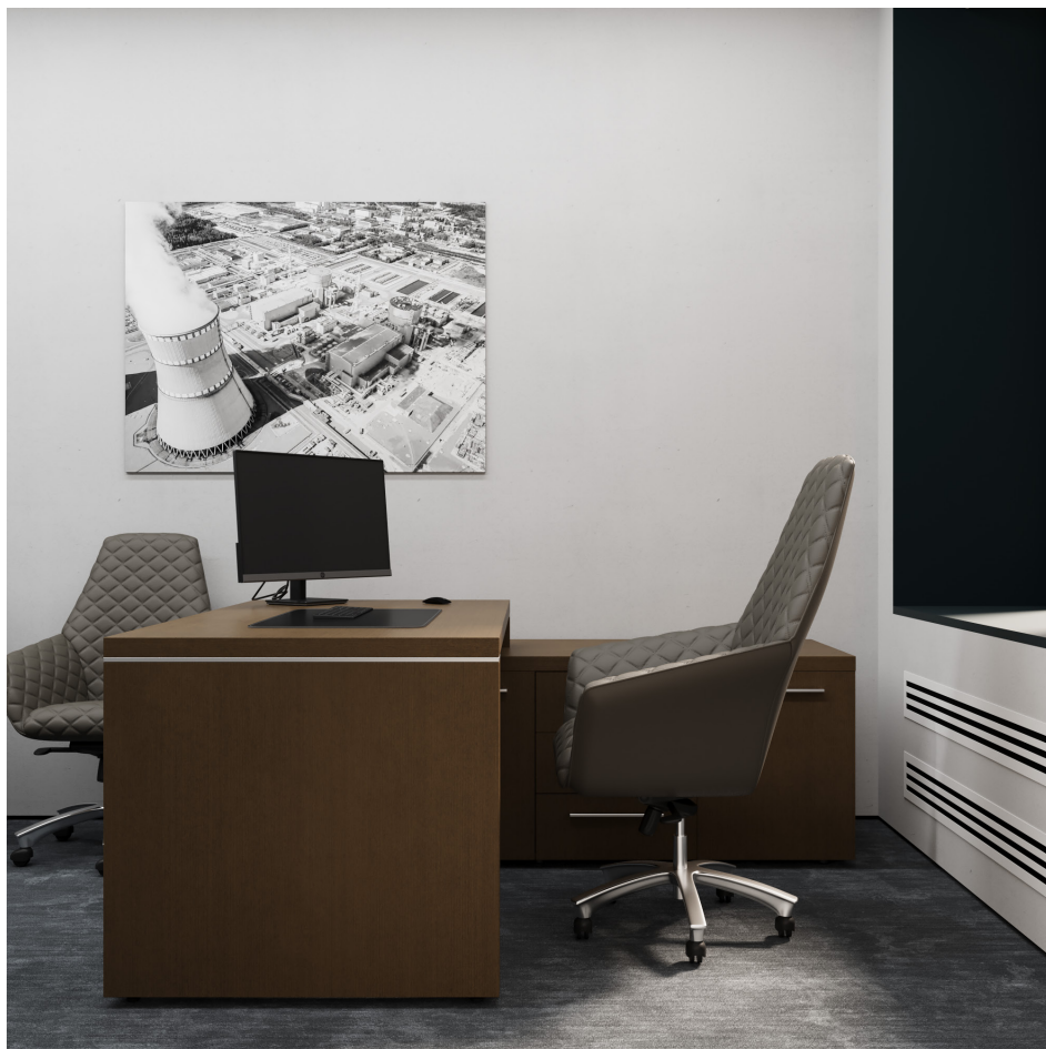
Помещение 5.31. Вид 5. Кабинет заместителя генерального директора.