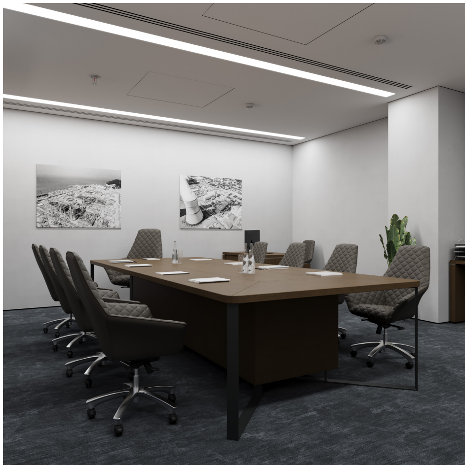
Помещение 5.32. Вид 1. Переговорная.