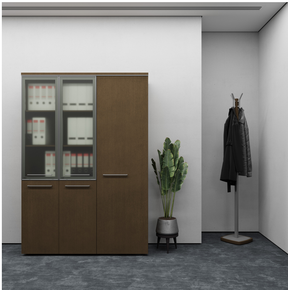
Помещение 5.31. Вид 3. Кабинет заместителя генерального директора.