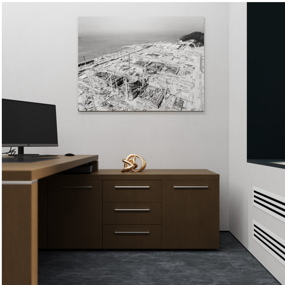
Помещение 5.30. Вид 3. Кабинет генерального директора.