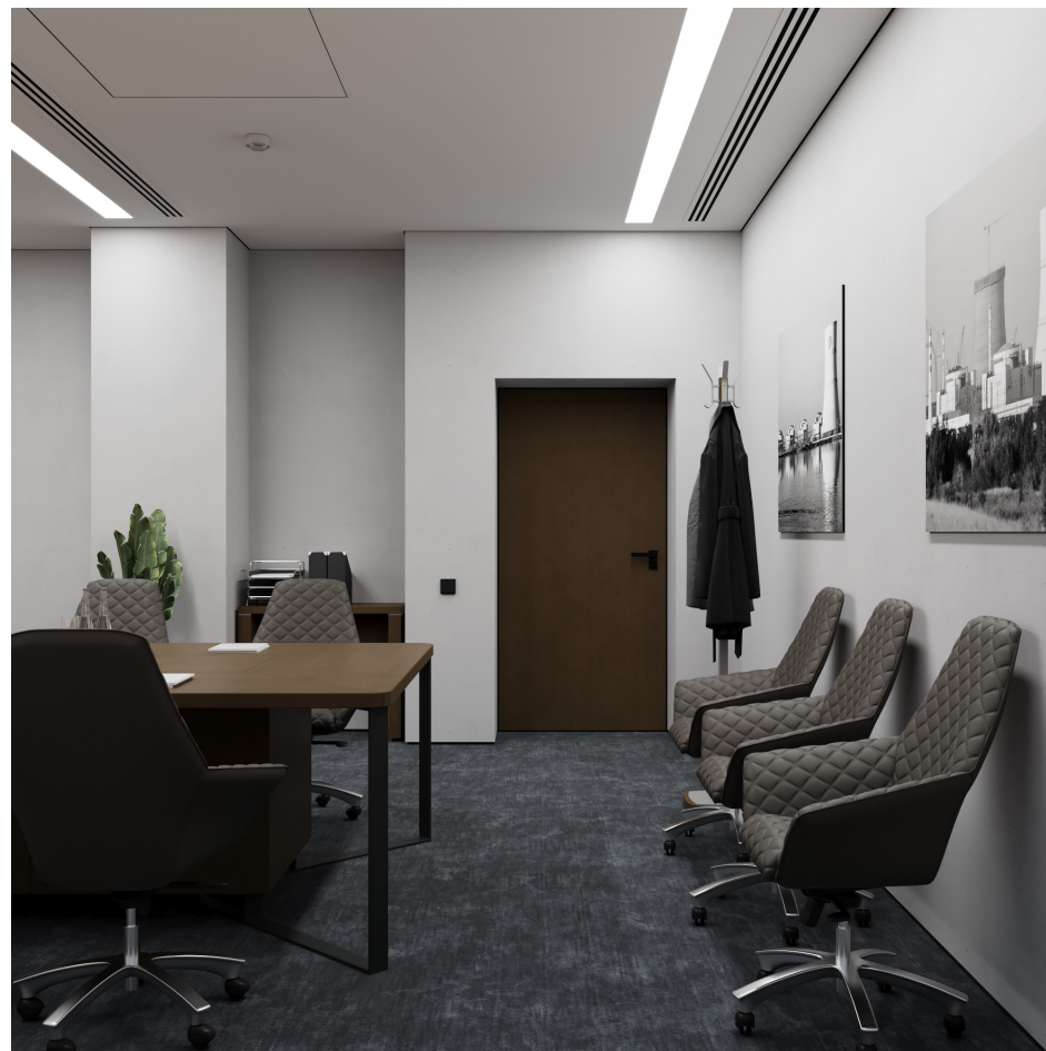
Помещение 5.32. Вид 4. Переговорная.