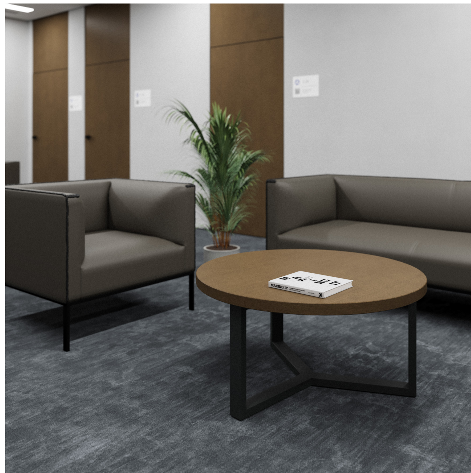
Помещение 5.1. Вид 6. Холл.