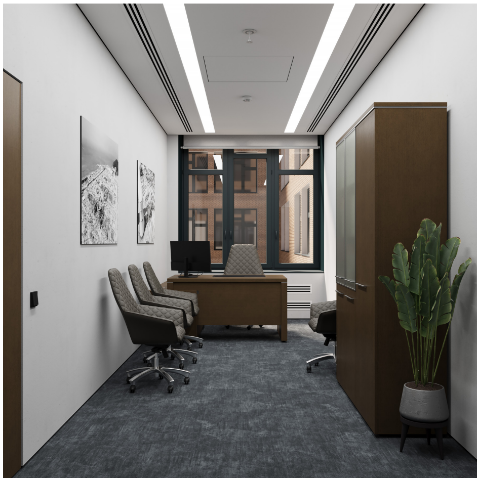
Помещение 5.31. Вид 1. Кабинет заместителя генерального директора.