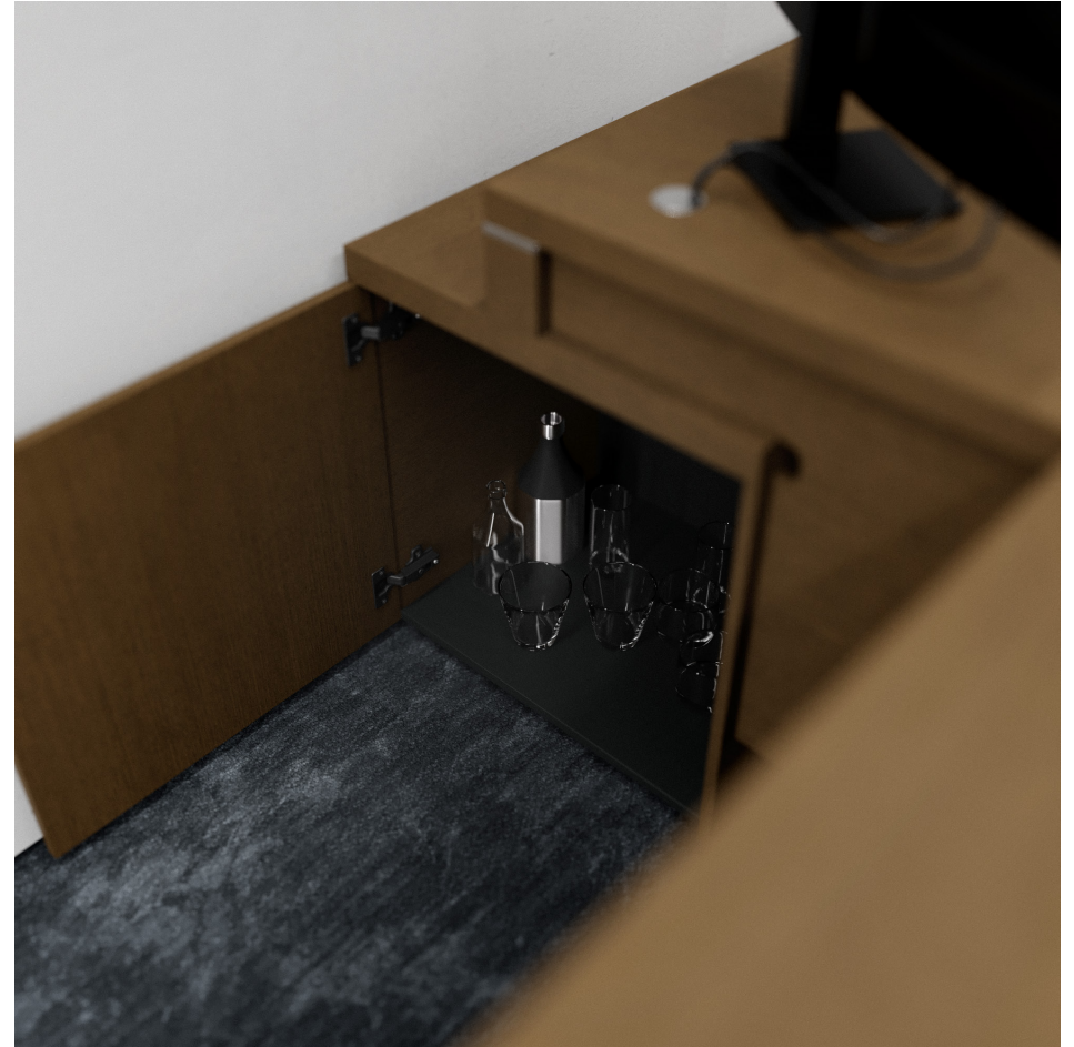
Помещение 5.30. Вид 6. Кабинет генерального директора.