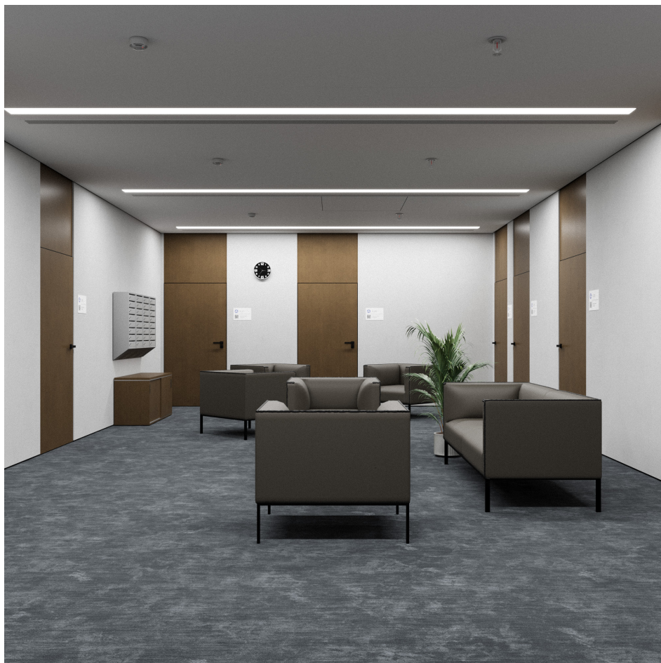
Помещение 5.1. Вид 1. Холл.