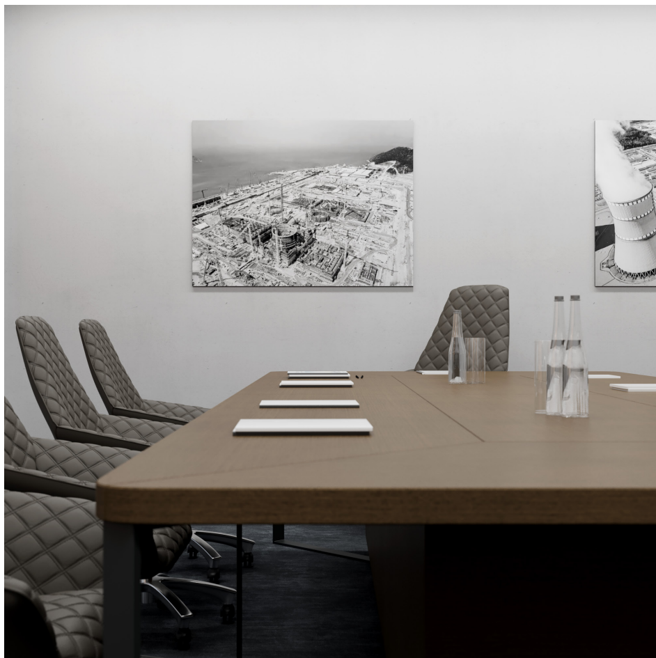
Помещение 5.32. Вид 3. Переговорная.