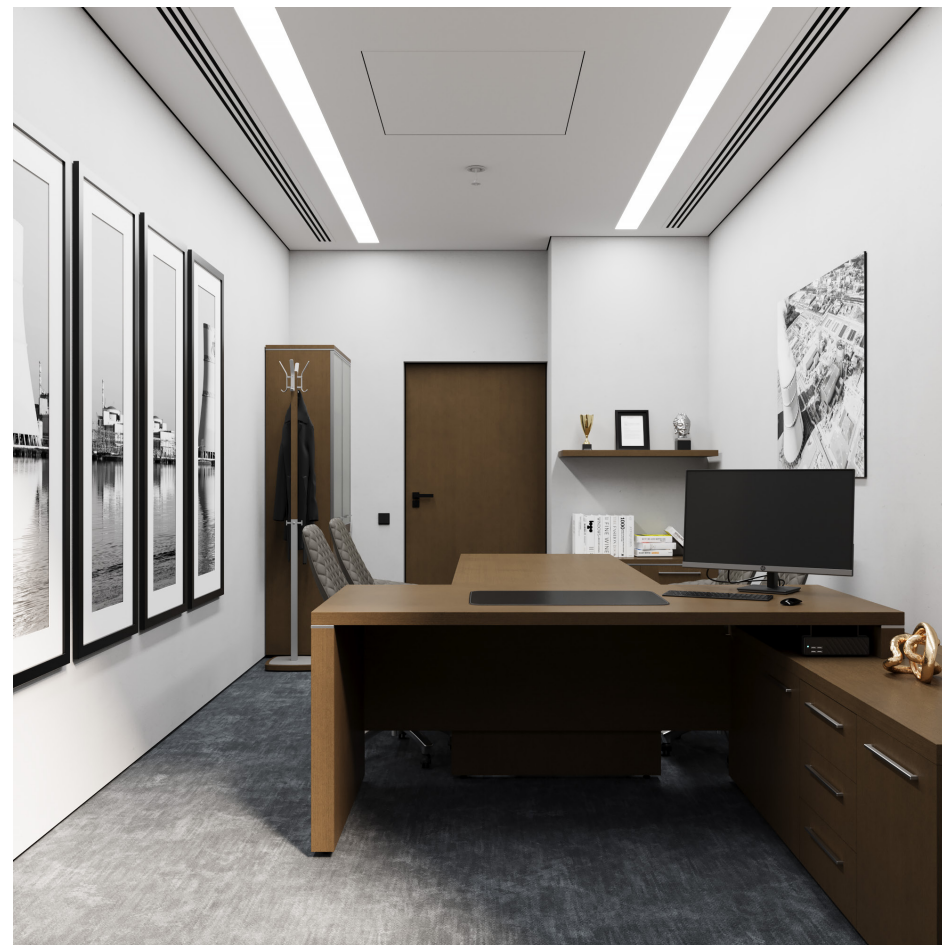
Помещение 5.30. Вид 2. Кабинет генерального директора.