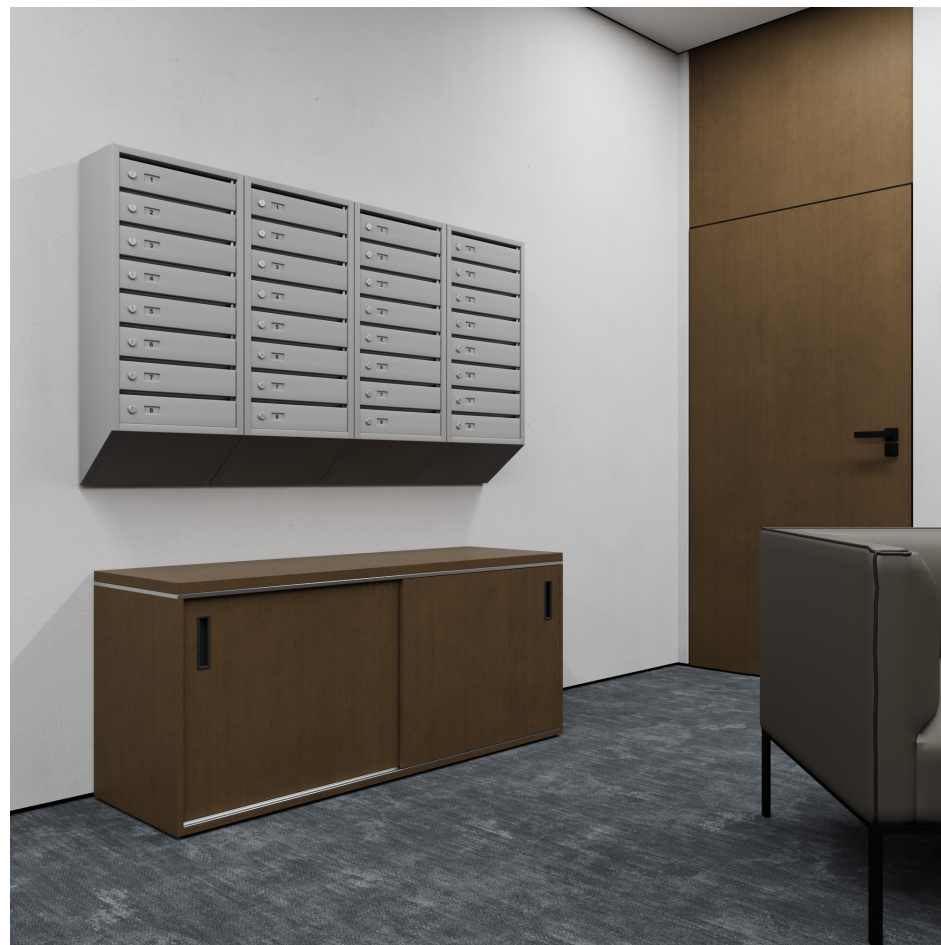
Помещение 5.1. Вид 4. Холл.