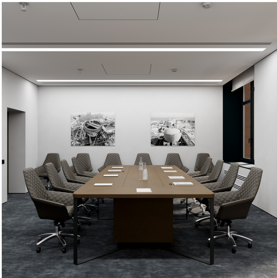
Помещение 5.27. Вид 1. Переговорная.